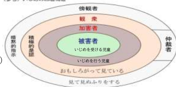
(参考) いじめの四層構造

「観衆」や「傍観者」が「仲裁者」になることで、いじめの拡大防止、早期発見につながる。